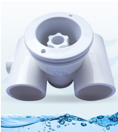
Boquillas de hidroasaje