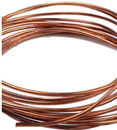
Cable de cobre para instalaciones eléctricas