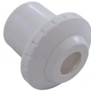
Boquillas de retorno y succión