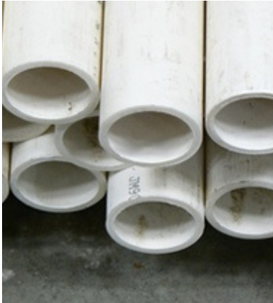
Tubo PVC Ced.40 1.5" y 2"