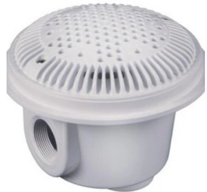
Desnatadores, rejillas y drenes